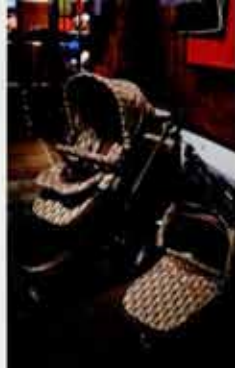
유모차 같은 라이프스타일 아이템부터 세련된 분위기까지 '제니 루 웨어'까지 색선택으로 잘 정돈돼 있다.