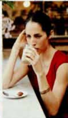
케롤리나 헤레라 바예즈처럼 나 홀로 에스프레소를 한 잔 마시러 오는 손님도 많다.