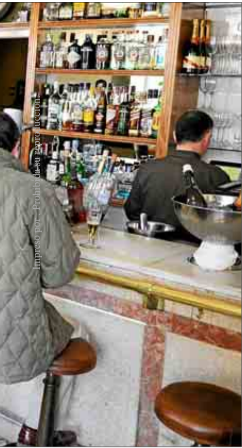
La barra genuina del Café Murillo, frente al Botánico.

Programación. Toda la información en www.madrid.org .