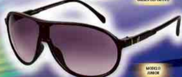
MODELO UNISEX DEPORTIVO