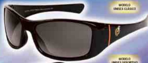
MODELO UNISEX CLÁSICO